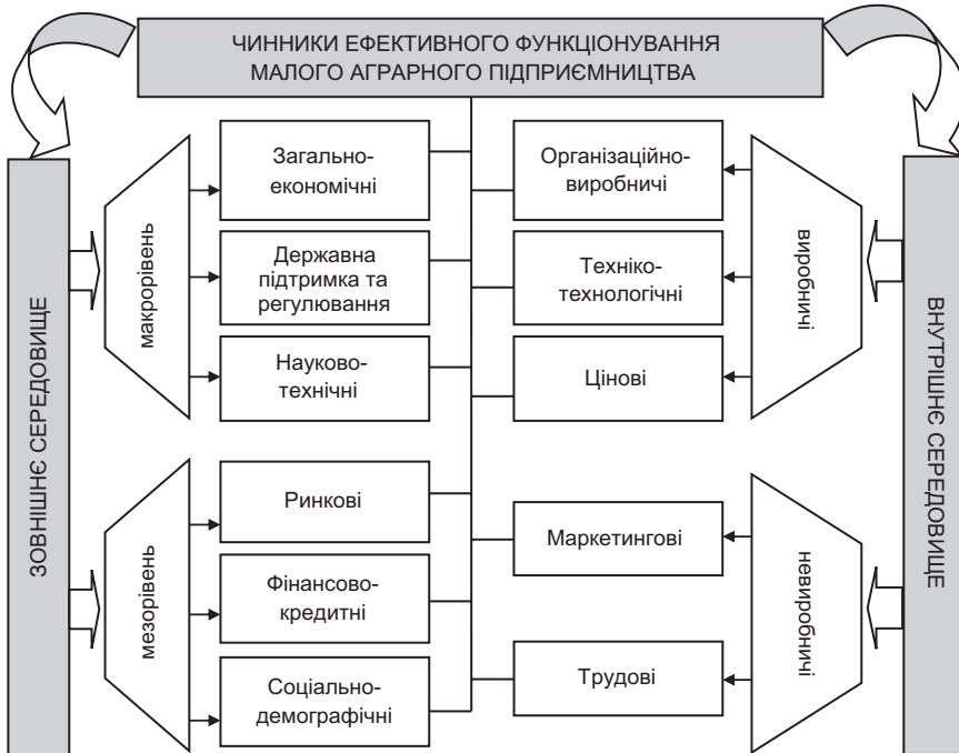
Рис. 2. Чинники ефективного функціонування малого аграрного підприємства

Проте нині державна аграрна політика у цій сфері нагадує сукупність неузгоджених між собою заходів, спрямованих на вирішення короткотермінових проблем